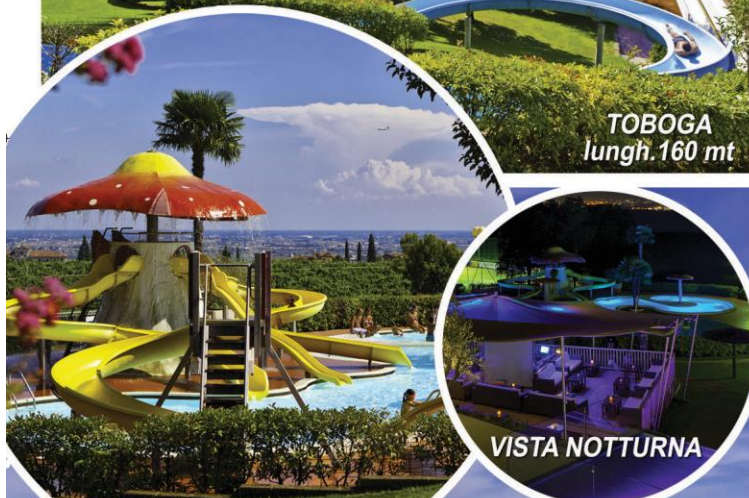
TOBOGA lungh. 160 mt