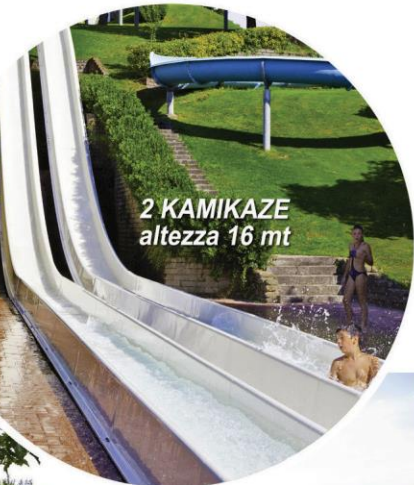
2 KAMIKAZE altezza 16 mt