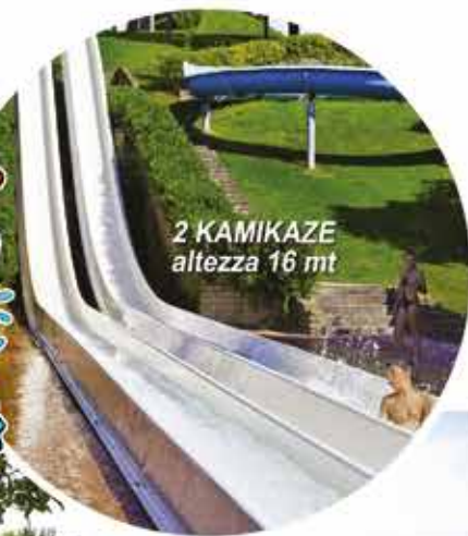
2 KAMIKAZE altezza 16 mt